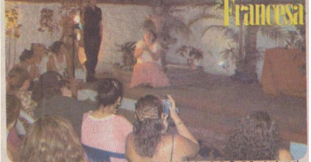
PRIMER acto de "La tragi-comedia de don Cristóbal y de la señorita Rosita", actuada en el género de la farsa.